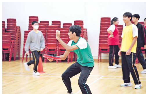
可立的學生多才多藝，讀得又玩得！

另外，學校鼓勵他們以積極樂觀的態度面對生活上的挑戰，每年都會舉辦正向教育工作坊、成長計劃、朋輩輔導員計劃，還有健康月等，這些都是幫助學生促進身心靈成長，學校與優秀的教師團隊盡心盡力用心教導，盼望學生們有一個愉快的校園生活。「可立中學與時並進、創新求變，我們會繼續努力，提供優質教育，裝備同學迎接未來的挑戰。同學經過 6 年栽培後，能夠肯定自己的價值，這是可立的使命。」