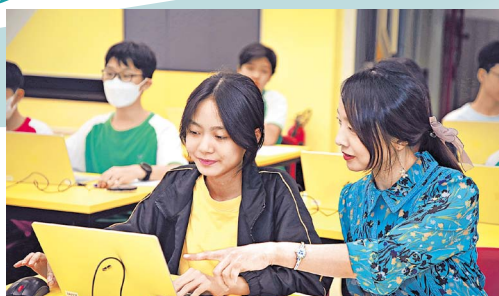
黎校長為學校營造「沉浸式英語學習環境」，讓同學多聽多講英語。

的啟發，可能她一直只停留在那個 level，但當我們去啟發她的時候，是可以發揮學生的無限可能。」