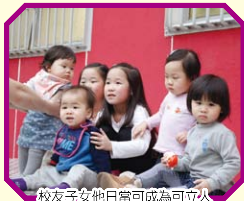
校友子女他日當可成為可立人