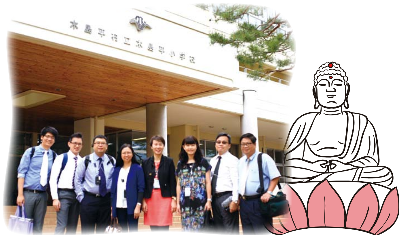
可立同寅拍照留念

在是次的考察交流中，我深刻體會到日本在推行協同學習後的一些學習成果。在協同學習中，學生的學習態度和思考方法，以至在整體教學理念上，那種平等和重視過程的概念，都很值得我們去反思和借鏡。