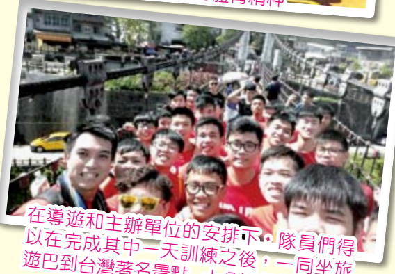
在導遊和主辦單位的安排下，隊員們得以在完成其中一天訓練之後，一同坐旅遊巴到台灣著名景點，十分進行觀光交流