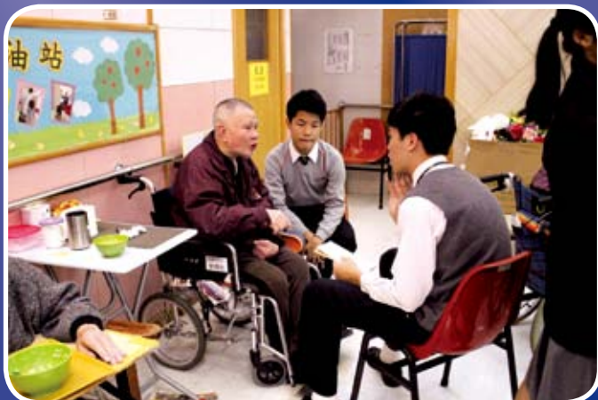
同學會定期探訪長者八次，每次長者都會跟同學分享他們年青時的點滴。

本學年，我們安排了四次賣旗活動，及參與由社會福利處舉辦的「耆樂相傳」老人院探訪活動，讓所有中三及中四級同學皆有機會嘗試參與服務社區，回饋社會。