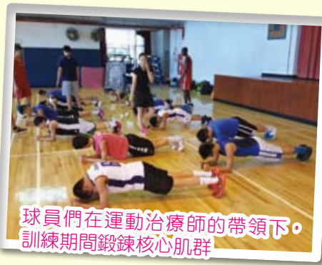
球員們在運動治療師的帶領下，訓練期間鍛鍊核心肌群