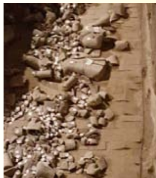
出土文物本貌：一堆『真而不美』的碎片