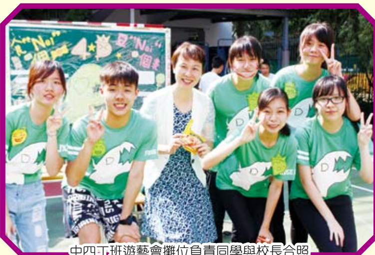
中四丁班遊藝會攤位負責同學與校長合照