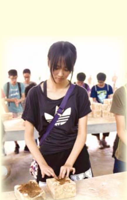
同學用心製作小型兵馬俑