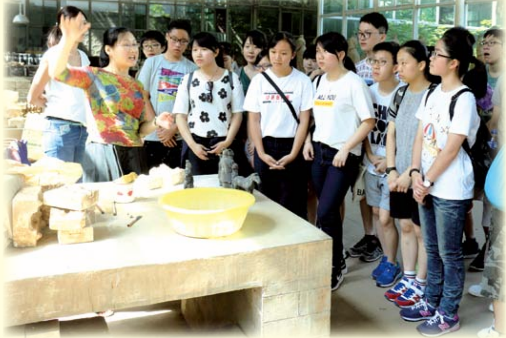
同學專心聆聽導師講解如何製作小型兵馬俑