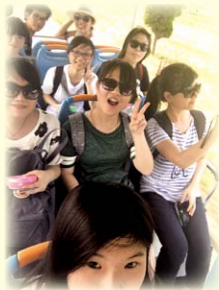
乘坐電動車遊秦始皇陵園的同學