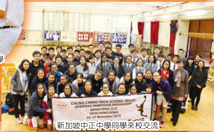
新加坡中正中學同學來校交流