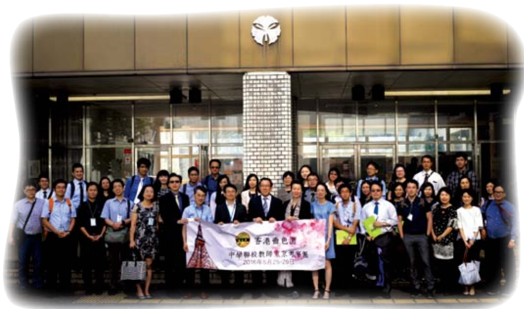
靚色園中學聯校教師日本教育考察團於參觀東大附屬中時全體合照