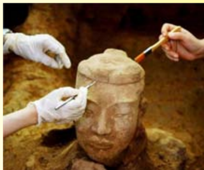
專家復修文物，當世才能欣賞秦俑之美