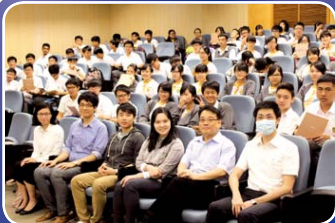
講者與全體參與師生在康本國際大樓一號演講廳拍照留念。