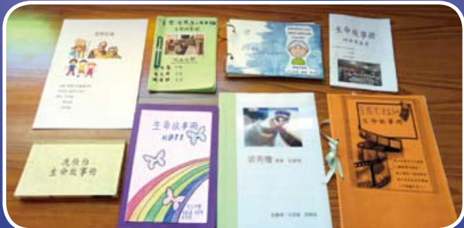
同學每次探訪都會用心記下長者的良言，並盡心製作「生命故事冊」，送給長者做禮物。