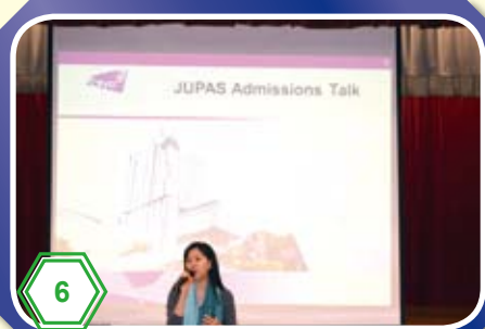
城大招生處講者講述其學士學位課程的入學資料。