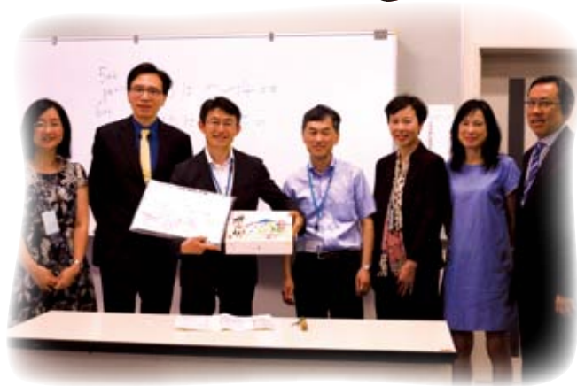
靚色園五所中學校長向東大附中副校長沖濱真治（圖中左三）致送紀念品