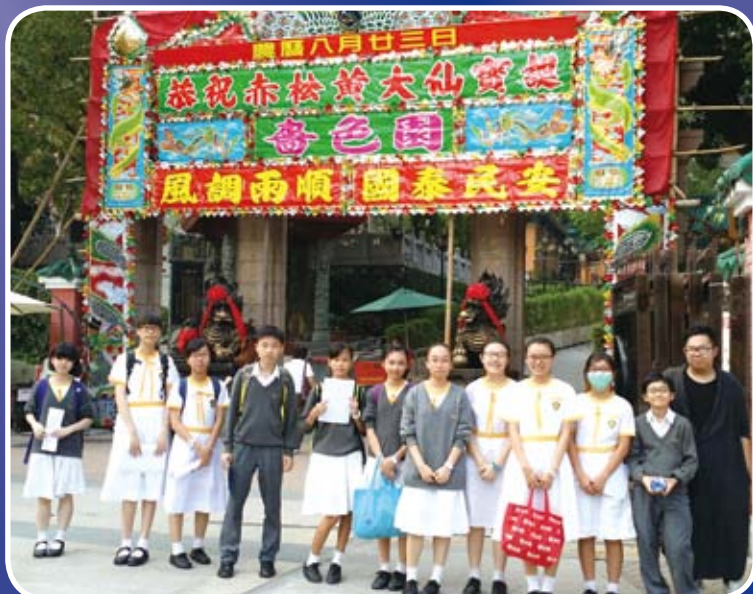
同學們親身到黃大仙祠實地考察，學習正確導賞技巧。