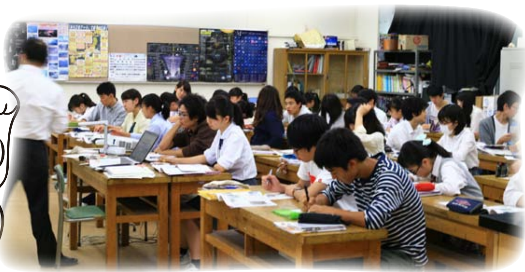
日本學校進行「協同學習」的上課情況

這次觀課能一新大家的耳目，反思協同學習的成功之處。學生專注有禮，尊重老師，尊重同學；教師友善對待同學，關注他們的課堂表現，才能令課堂氣氛和諧。至於在一些艱深課題上讓同學分組協作，深入研討，也對大家在以後教學時有所啟發。