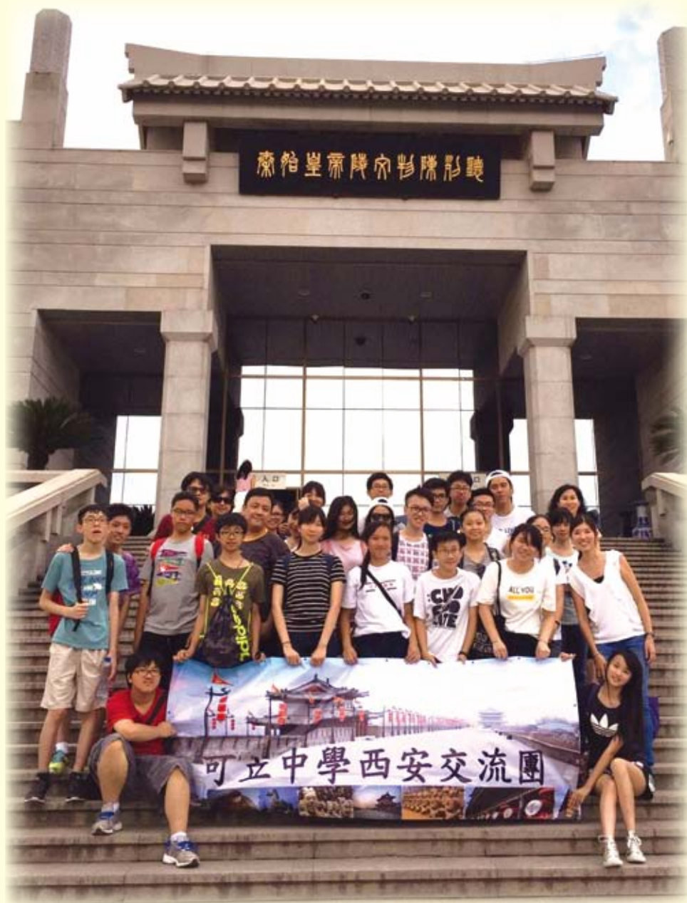
秦始皇帝陵博物館前合照