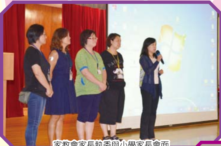
家教會家長執委與小學家長會面