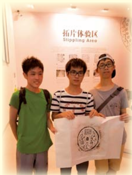
唐代大明宮拓片體驗