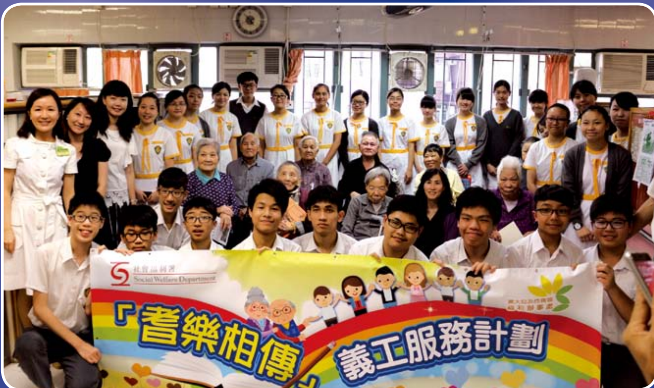
參與「耆樂相傳」活動的同學與「松齡老人院」的長者、社工，及社會福利處的社工合照留念。