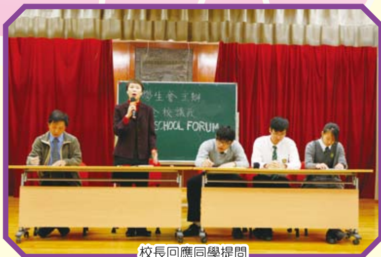
校長回應同學提問