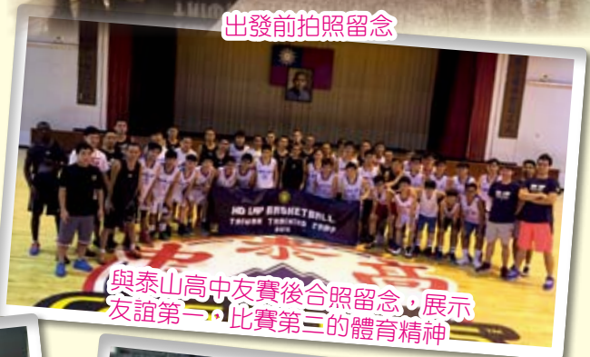
與泰山高中友賽後合照留念，展示友誼第一，比賽第三的體育精神