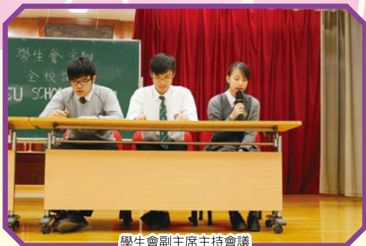
學生會副主席主持會議