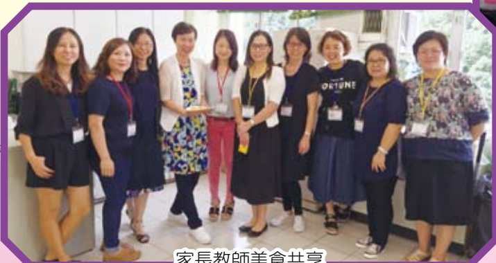
家長教師美食共享