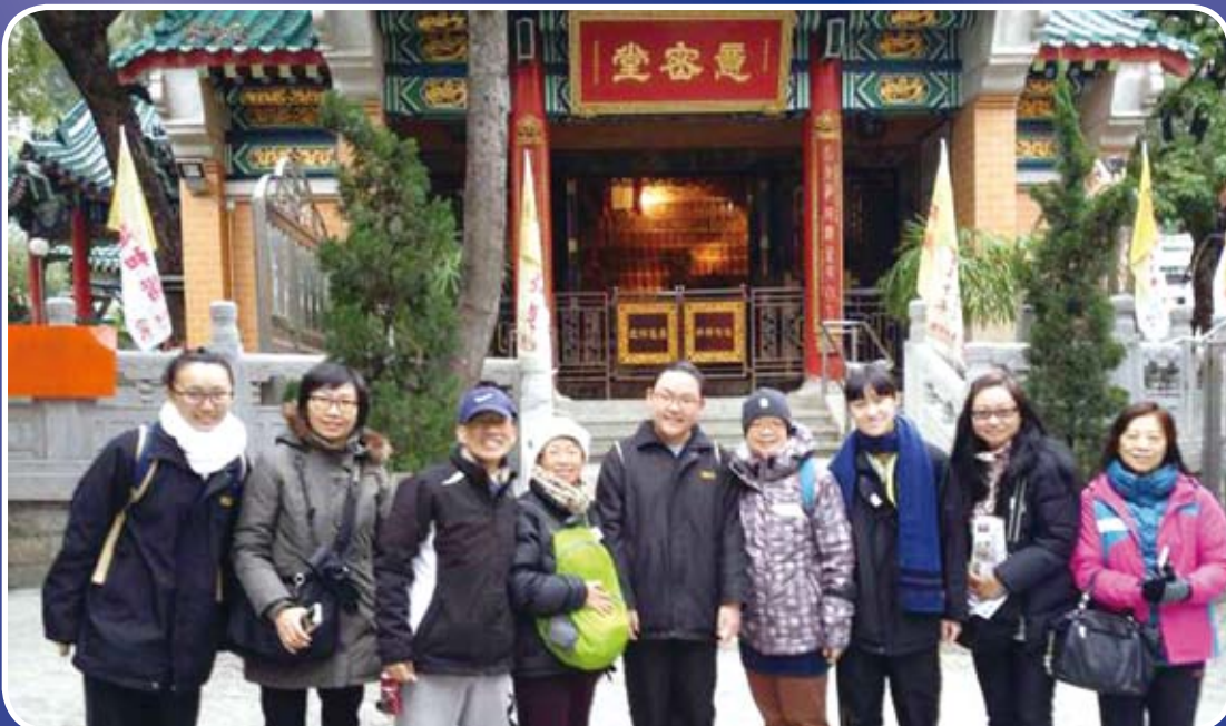
學生導賞員帶領參觀者認識黃大仙祠的建築和宗教特色。