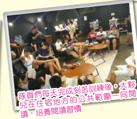
隊員們每天完成刻苦訓練後，大夥兒在住宿地方的公共範圍一同閱讀，培養閱讀習慣