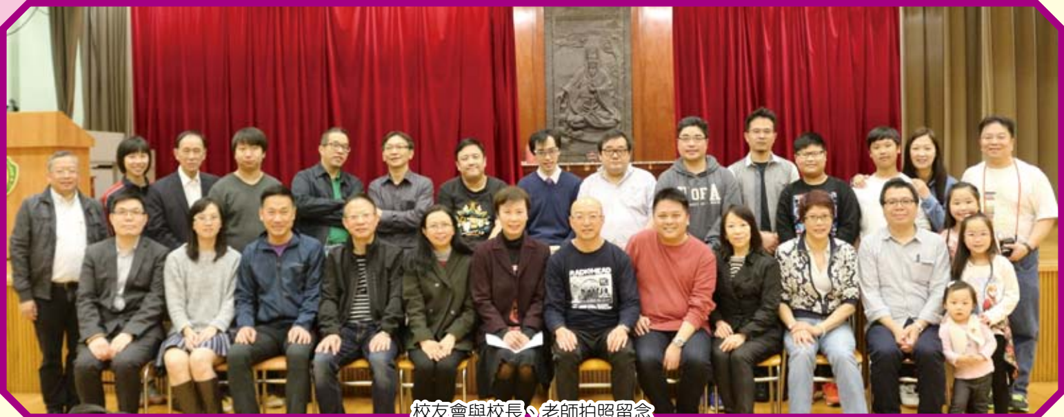
校友會與校長、老師拍照留念