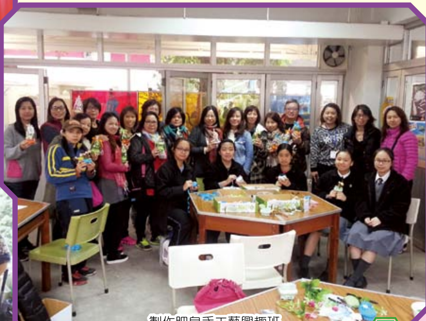
製作肥皂手工藝興趣班