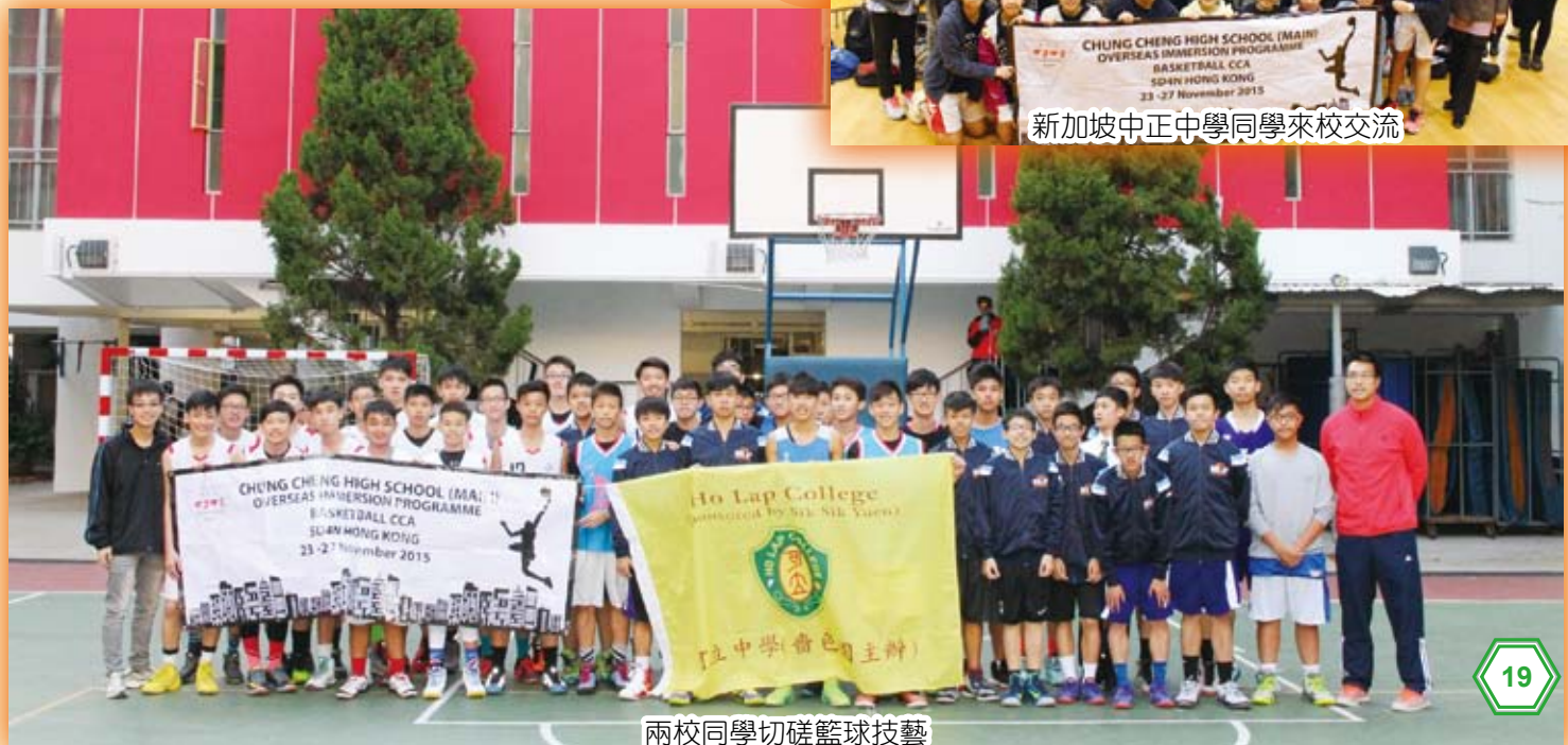
兩校同學切磋籃球技藝