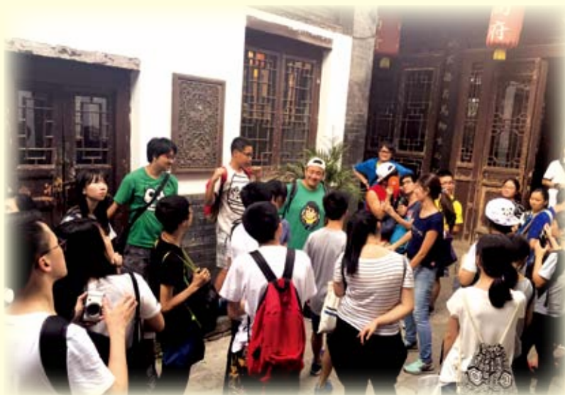
西安高家大院內論陶淵明田園詩