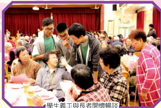
學生義工與長者開懷暢談