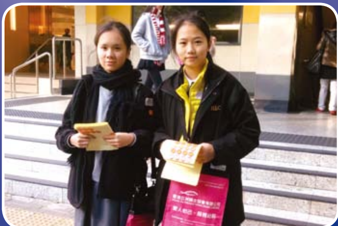
參與賣旗活動熱心的同學