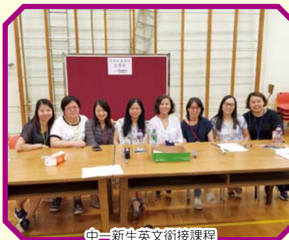
中一新生英文銜接課程