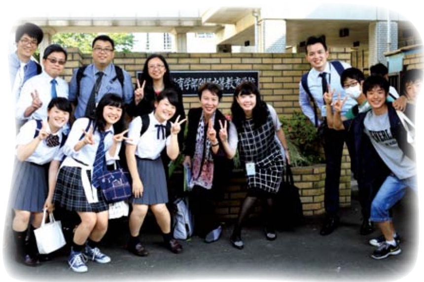
可立同事與日本學生月同來過 V 字手勢