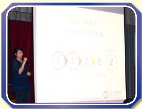
恆生管理學院講者講述其自資學士學位課程的入學資料。

為使本校中五、中六同學更能掌握其自資學士的入學資料，我們特意邀得恆生管理學院招生處親臨本校講述其自資學士學位課程的入學資料，以協助同學了解多元的出路及早作升學準備。