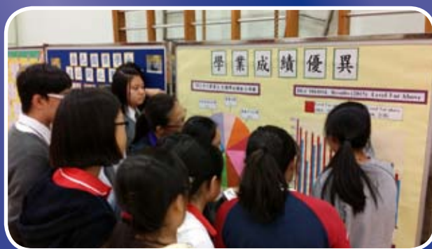
學生導賞員在學校資訊日向來訪的學生和家長介紹本校學生優異的學業成績。