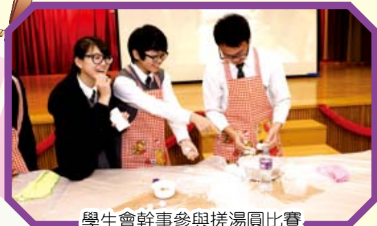
學生會幹事參與搓湯圓比賽