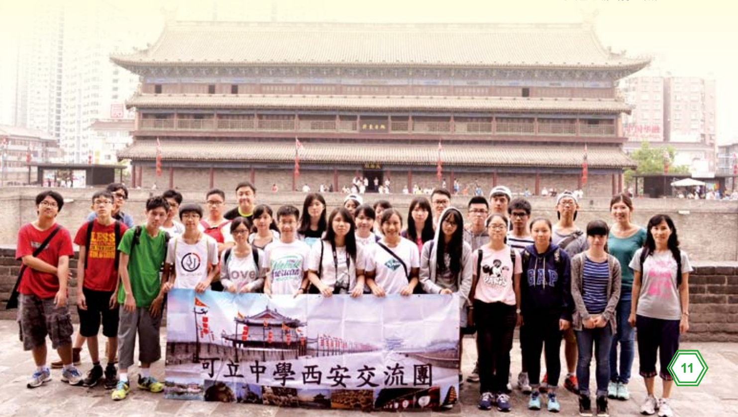
西安古城牆前合照