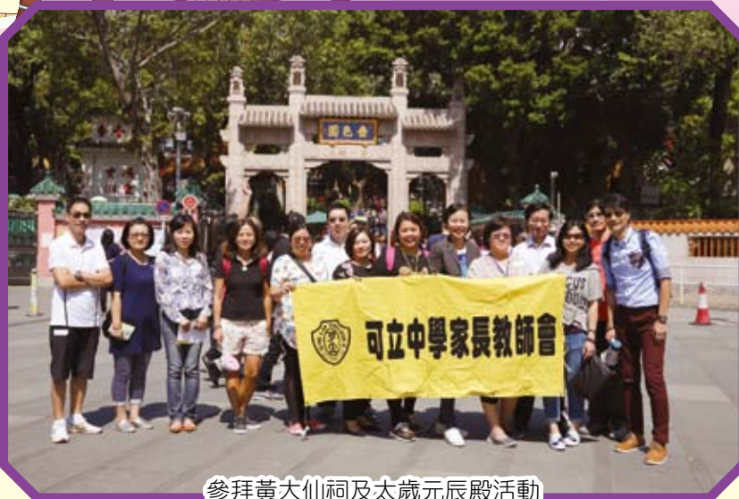
參拜黃太仙祠及太歲元辰殿活動