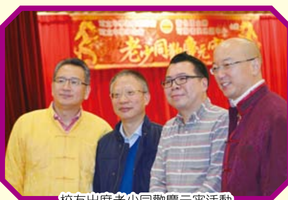
校友出席老少同歡慶元宵活動