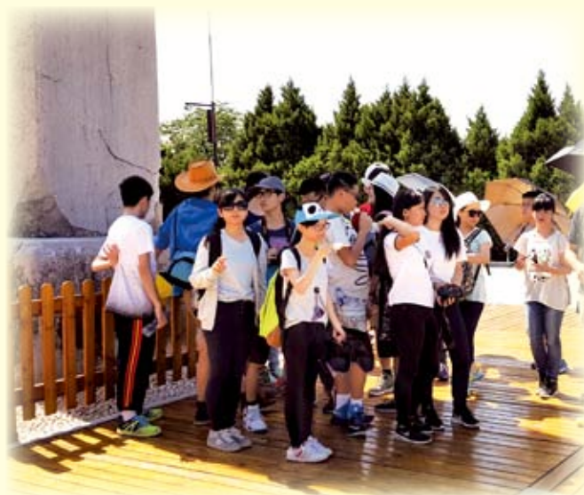
武則天墓前無字碑的用途：遮蔭