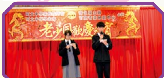
學生會幹事為老少同歡慶元宵活動擔任司儀