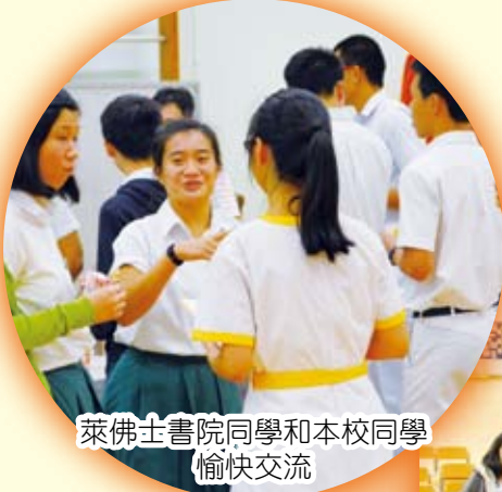
萊佛士書院同學和本校同學愉快交流

新加坡兩所著名中學（中正中學、萊佛士書院）的師生分別蒞臨本校交流。中正中學同學更與本校同學作籃球比賽，增進友誼。萊佛士書院同學亦參與經濟及企業、會計及財務概論科課堂，兩校同學在學業上切磋琢磨，深得以友輔仁之樂。