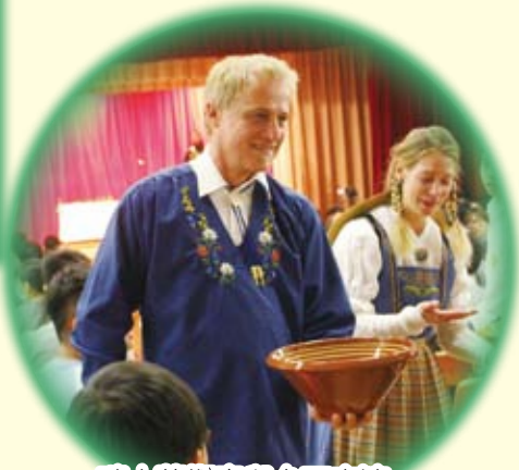
瑞士藝術家與台下交流