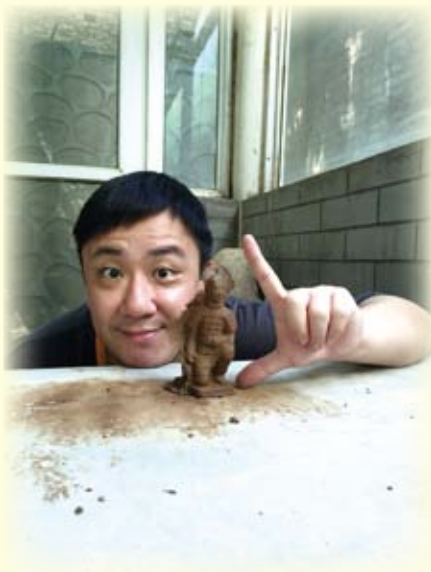
潘老師的小型兵馬俑